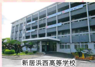
新居浜西高等学校