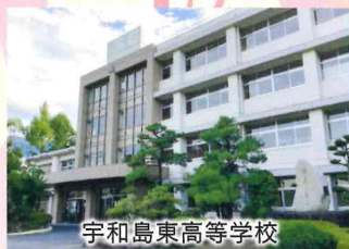
宇和島東高等学校