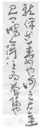
1年次 長野 咲来