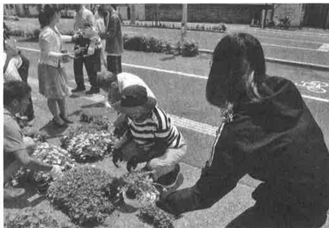
花いっぱい運動 (6月13日)