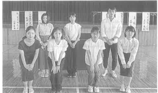
校内生徒生活体験発表会 (7月19日)