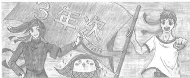
3 年 次