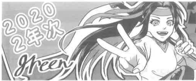
2 年 次