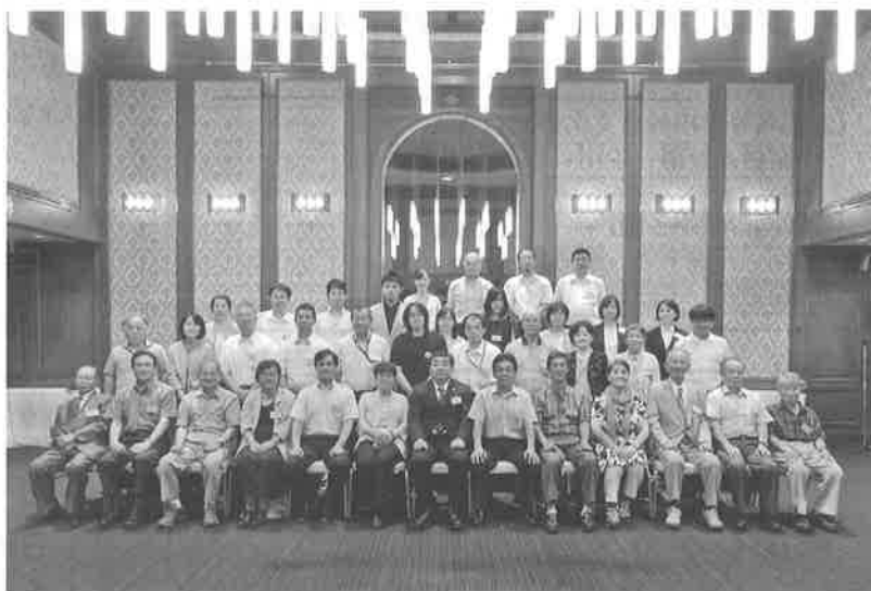
同窓会記念写真です。

午前11時からの総会では、活動報告や会計報告などの議案が可決・承認されました。総会のあと、引き続き懇親会が行われ、卒業時期や年齢に関係なく、参加者同士で大いに盛り上がりました。