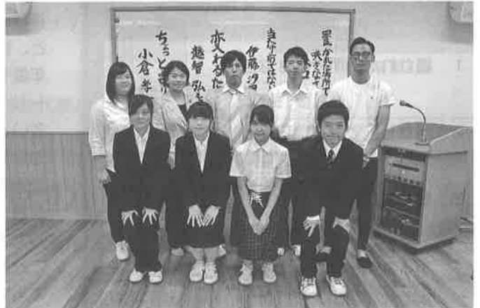
校内生活体験発表会 (7月23日)