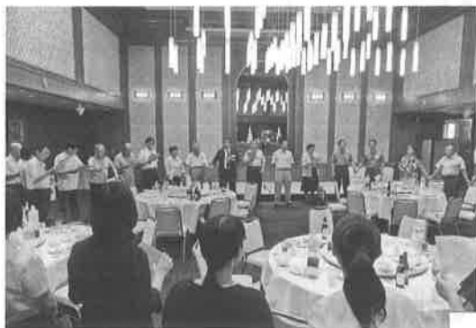
懇親会の最後は、全員で「通教の歌」を歌いました。

今回の同窓会懇親会には、卒業したばかりの同窓生が積極的に参加し、先生方やかつての友垣と楽しい語らいのひとときを過ごしました。